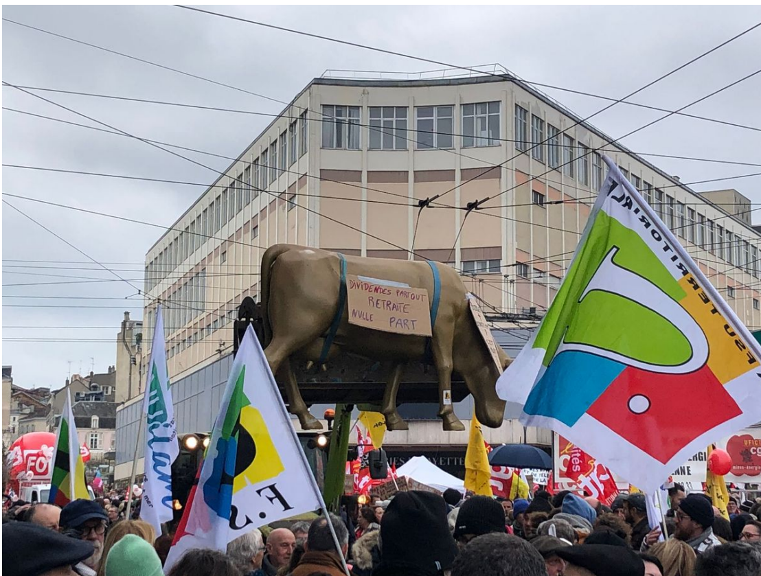
Mardi 7 mars 2023