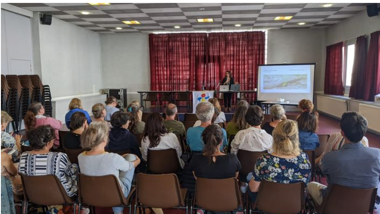
RIS mercredi 27 septembre 2023