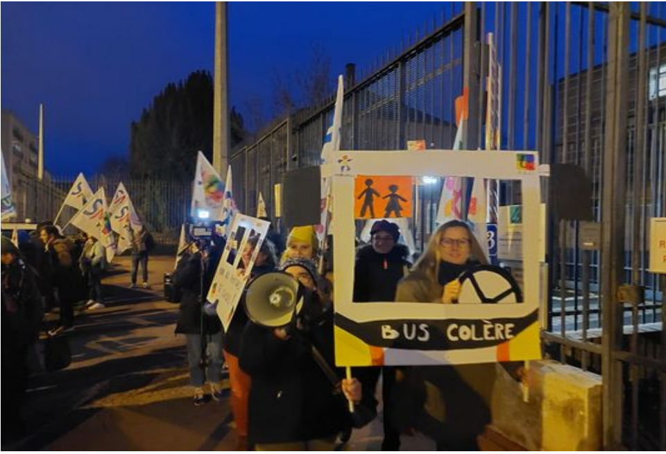
Mardi 17 janvier, rassemblement au rectorat