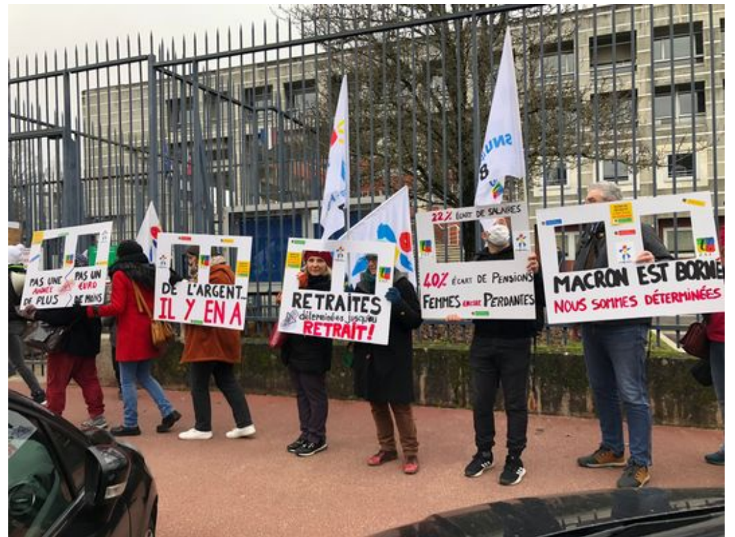
Jeudi 19 janvier, manif retraites